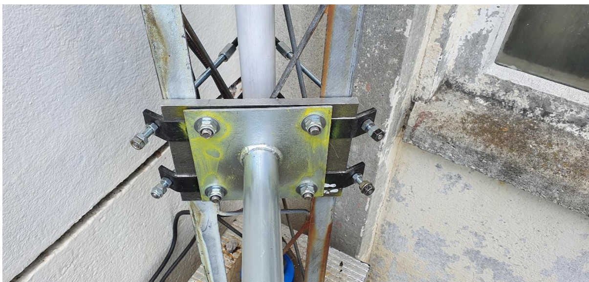
Support de parabole réalisation Jean-Paul F5UDK