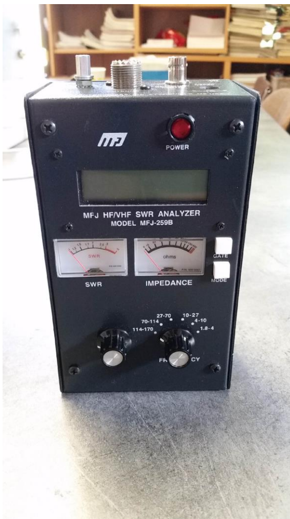
Pont d'impédance pour aériens HF et VHF