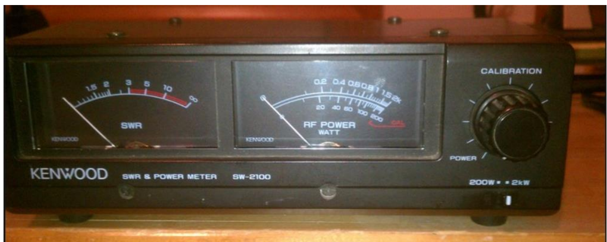
SWR puissance 2KW 30 MHz