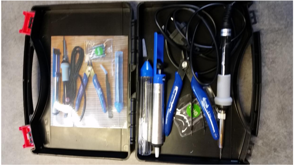
Malette de soudure / réparation sur circuits imprimés