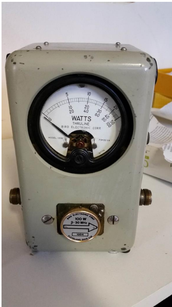
Mesures DIR/REF HF et VHF