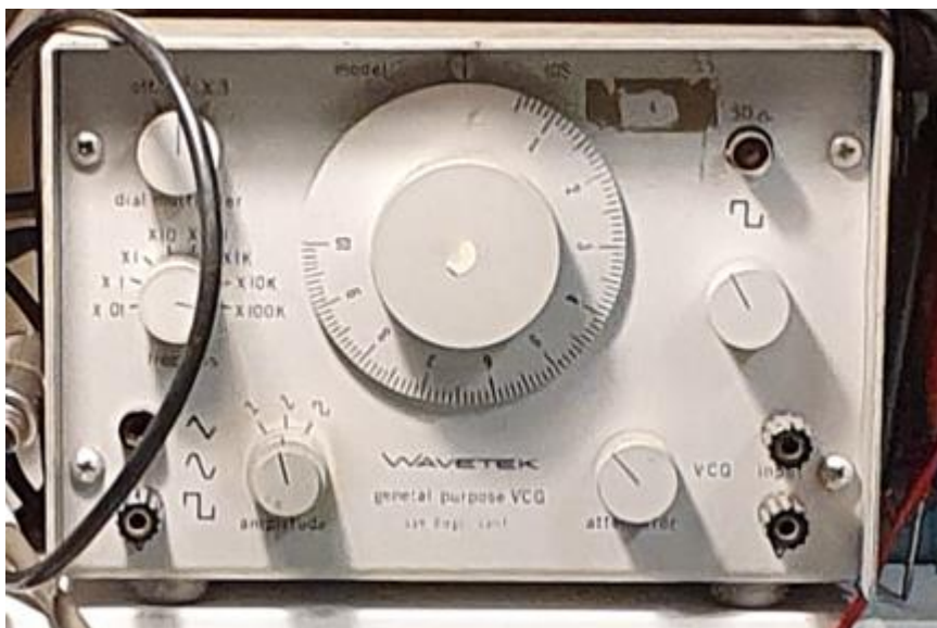
12/2022 GENERATEUR HF 100Hz à 1MHz sinus/triangle/ carré