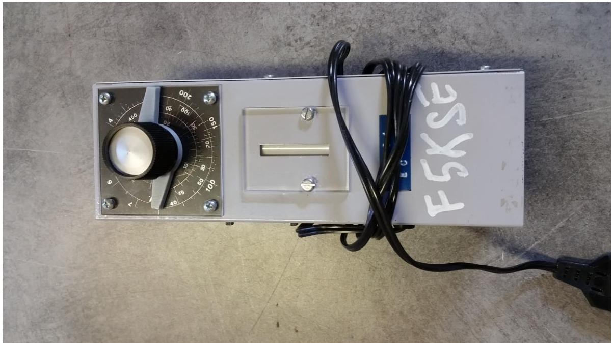
Grid dip F8CV HF et VHF