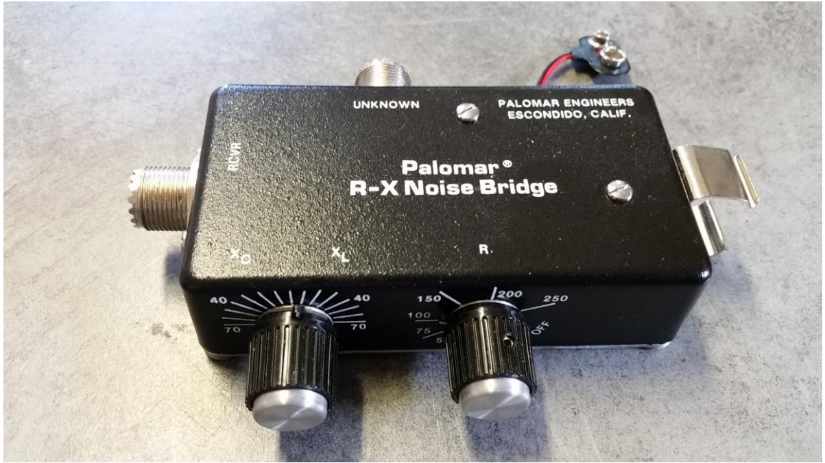
Pont d'impédance universel