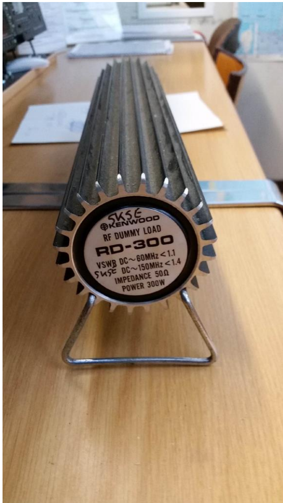
Charge 300W DC / 150 MHz