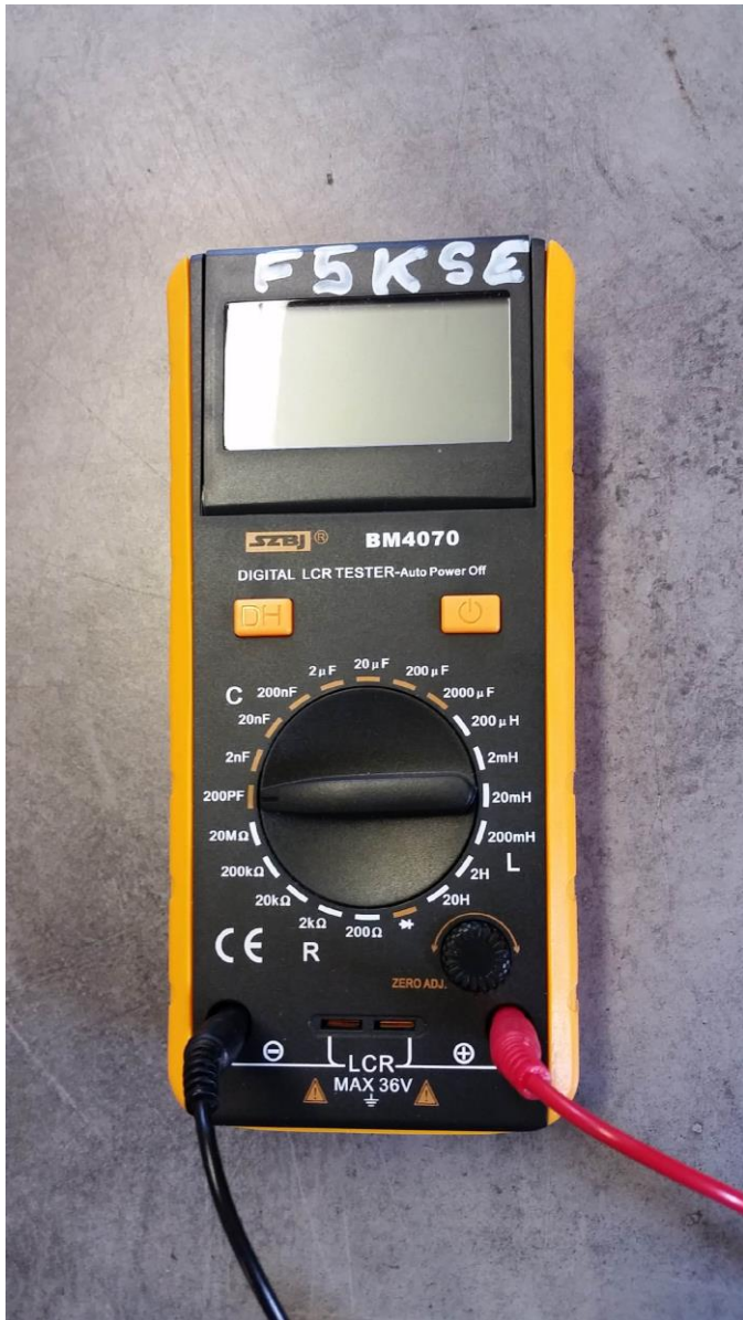
Mesureur R L C