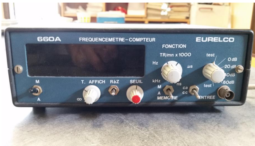
Compteur H F