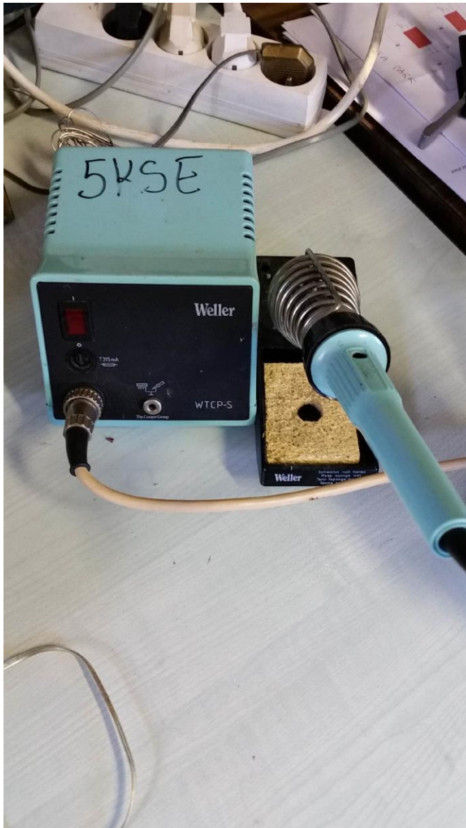
Station de soudure étain Weller