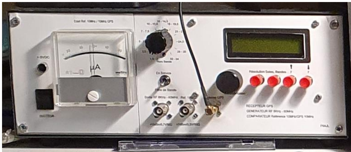
12/2022 RECEPTEUR GPS / GENERATEUR 50KHz à 60MHz /COMPARATEUR de PHASE (don de F6AJL)