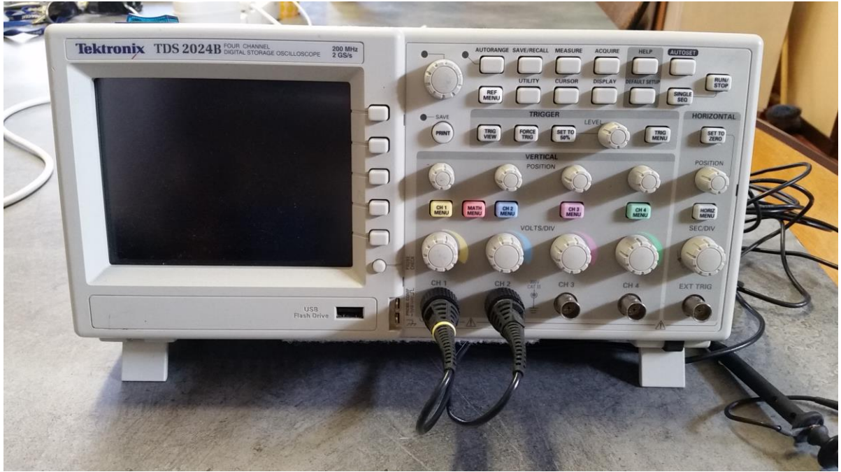
Oscilloscope 200 MHz