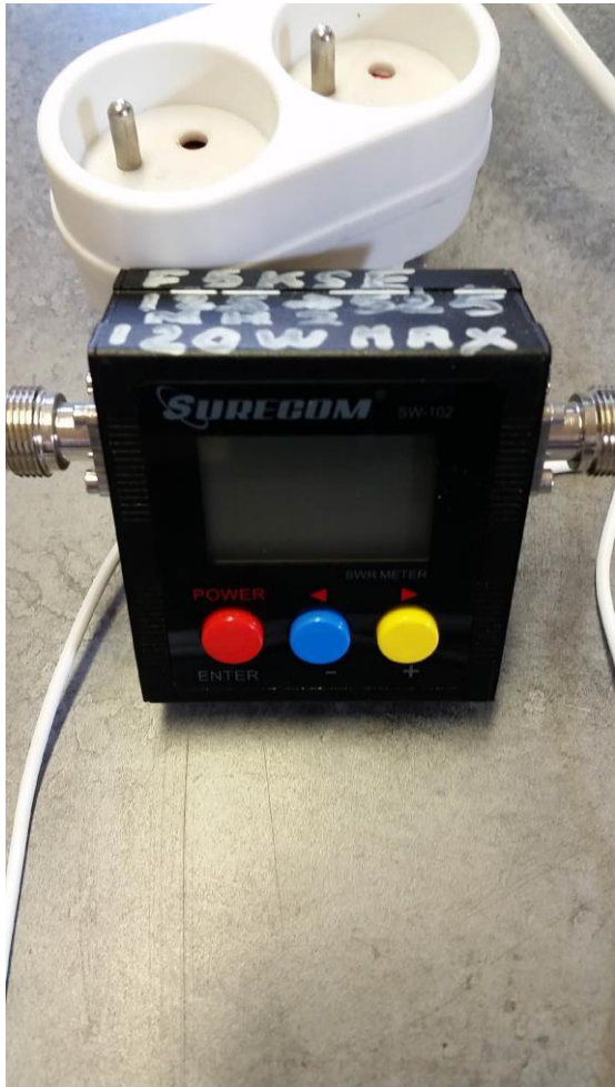
ROS / WATT numérique VHF