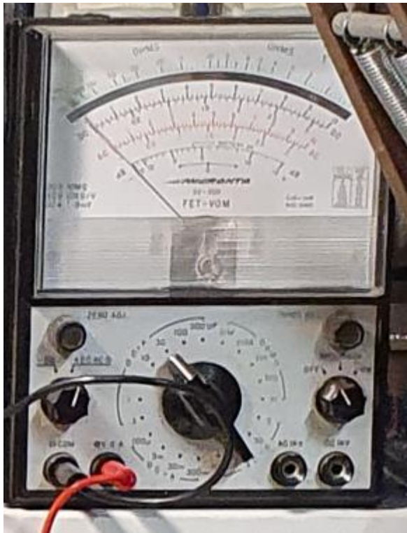
12/2022 MULTIMETRE à AIGUILLE