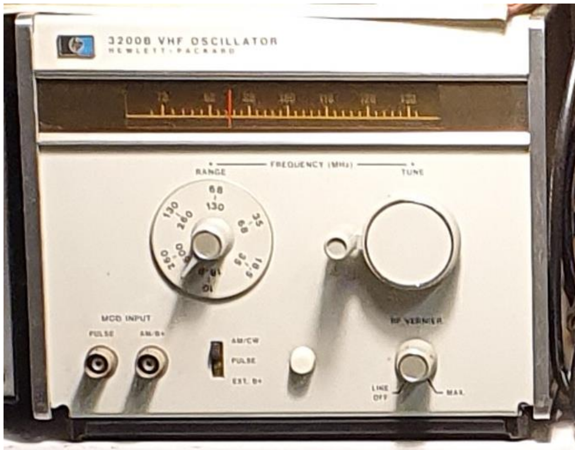
12/2022 GENERATEUR VHF 10 à 260 MHz