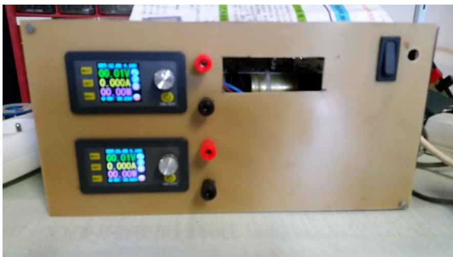
Alim DC double 0/30 V 3A, plus mesureur L et C (en cours de réalisation)