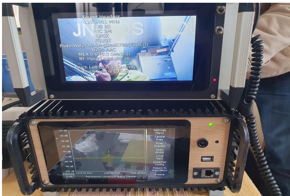
La vidéo reçue en haut et le calage en fréquence au moyen du boîtier analyseur de spectre