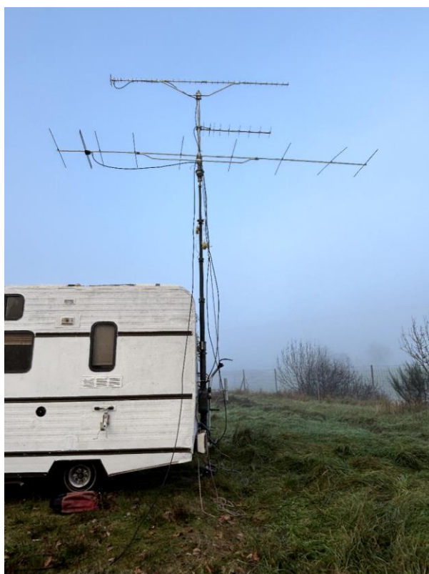
Les antennes : 2 m pour la voie de service et 70, 23 cm pour le trafic